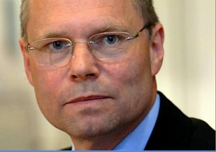
Dekan på JUS, UiO